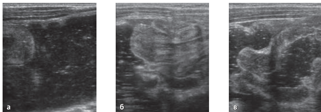
Рис. 1. Этапы дезинвагинации: а — заполнение толстой кишки жидкостью; б — смещение инвагината под воздействием гидростатического давления; в — полное расправление инвагината в области баугиниевой заслонки

Дезинвагинацию начинали с ретроградного заполнения толстого кишечника жидкостью. Мы используем слабый гипертонический (2,5%) раствор хлористого натрия, который позволяет избежать осложнений, связанных с гиперволемией. Жидкость вводится под давлением, которое зависит от высоты расположения кружки Эсмарха и измеряется в миллиметрах водного столба. Герметичность в системе обеспечивает obturator, фиксирующийся в анальном канале. Таким образом получается замкнутый контур, состоящий из ободочной кишки и инвагината, на который действует четко дозированное гидростатическое давление. На экране монитора УЗ-аппарата можно видеть все этапы дезинвагинации — заполнение толстой кишки жидкостью (а), смещение инвагината под воздействием гидростатического давления (б) и его полное рас-