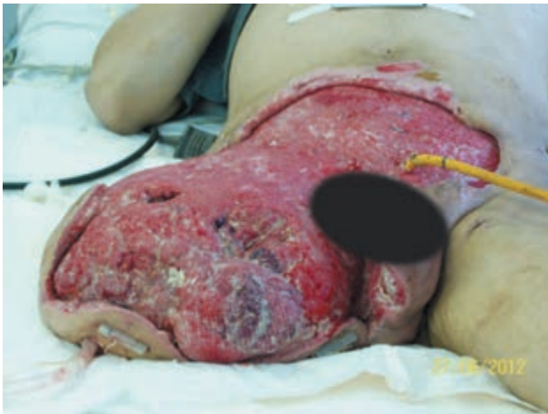
Рис. 3. Рана культы правого бедра, 27.06.2012