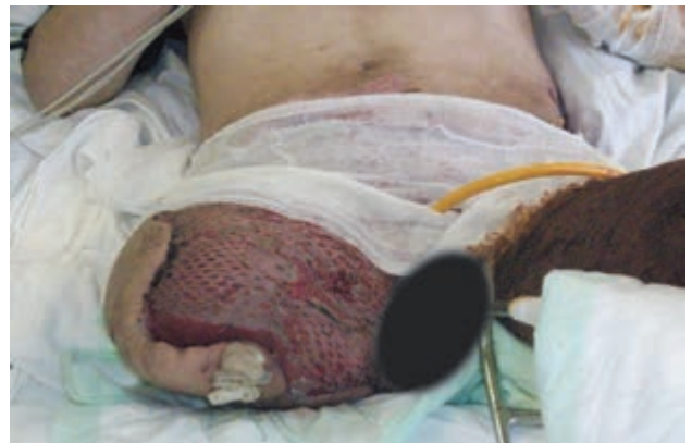
Рис. 5. Рана культы правого бедра после аутотрансплантации, 09.07.2012

14.08.2012 больной выписан в относительно удовлетворительном состоянии. После того как больной окончательно окрепнет в условиях урологической клиники предполагалось произвести пластику уретры.