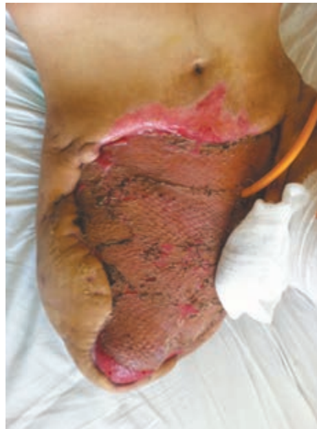
Рис. 7. Окрепшие лоскуты пересаженных аутодермотрансплантатов от 19.07.2012

Таким образом, получен положительный опыт лечения обширной травматической раны с помощью растворов пектинов и наночастиц серебра.