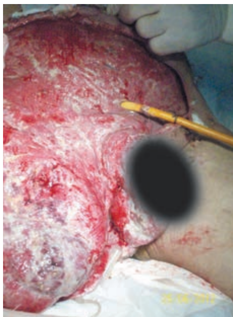
Рис. 2. Рана культы правого бедра, 25.06.2012