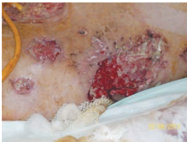
Рис. 1. Рана в области левого бедра после применения 3% яблочного пектина, 22.06.2012

25.06.2012, на 3-и сут после предыдущей перевязки в ране левого бедра выявлены: Proteus mirabilis 10 5 КОЕ/мл, P. aeruginosa 10 6 КОЕ/мл, Klebsiella spp. 10 5 КОЕ/мл, Acinetobacter spp. 10 5 КОЕ/мл, S. aureus 10 5 КОЕ/мл. В ране культы правого бедра, несмотря на применение таких антисептиков, как йодопирон и левомеколь, обнаруживали – Proteus mirabilis 10 6 КОЕ/мл, P. aeruginosa 10 5 КОЕ/мл, Corynebacterium spp. 10 6 КОЕ/мл. Вероятно, такая высокая обсемененность была обусловлена тем, что после предыдущей перевязки прошло 3 дня. На рис. 2 представлена рана культы правого бедра, при этом вся поверхность раневого дефекта покрыта фибрином и остатками нежизнеспособных тканей (мелкие влажные некрозы).