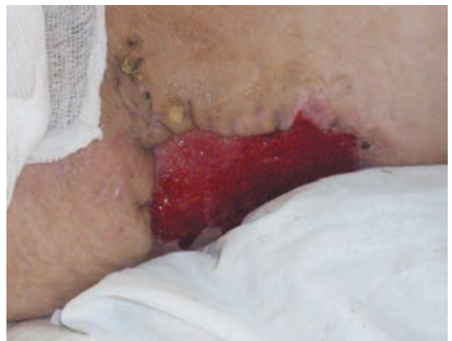
Рис. 6. Рана левого бедра с признаками краевой эпителизации, 09.07.2012