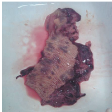
Рис. 4. Удаленная часть ободочной кишки вместе с кистой